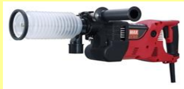
メーカー MAX株式会社