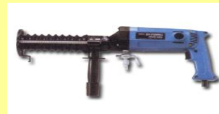
メーカー 株式会社ケー・エフ・シー